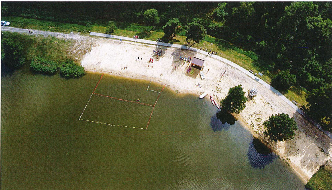
Długość linii brzegowej – 40 metrów

5) Zarządzający zapewnia przez okres otwarcia Miejsca Okazjonalnie Wykorzystywanego do Kąpielii dyżur dwóch ratowników wodnych.