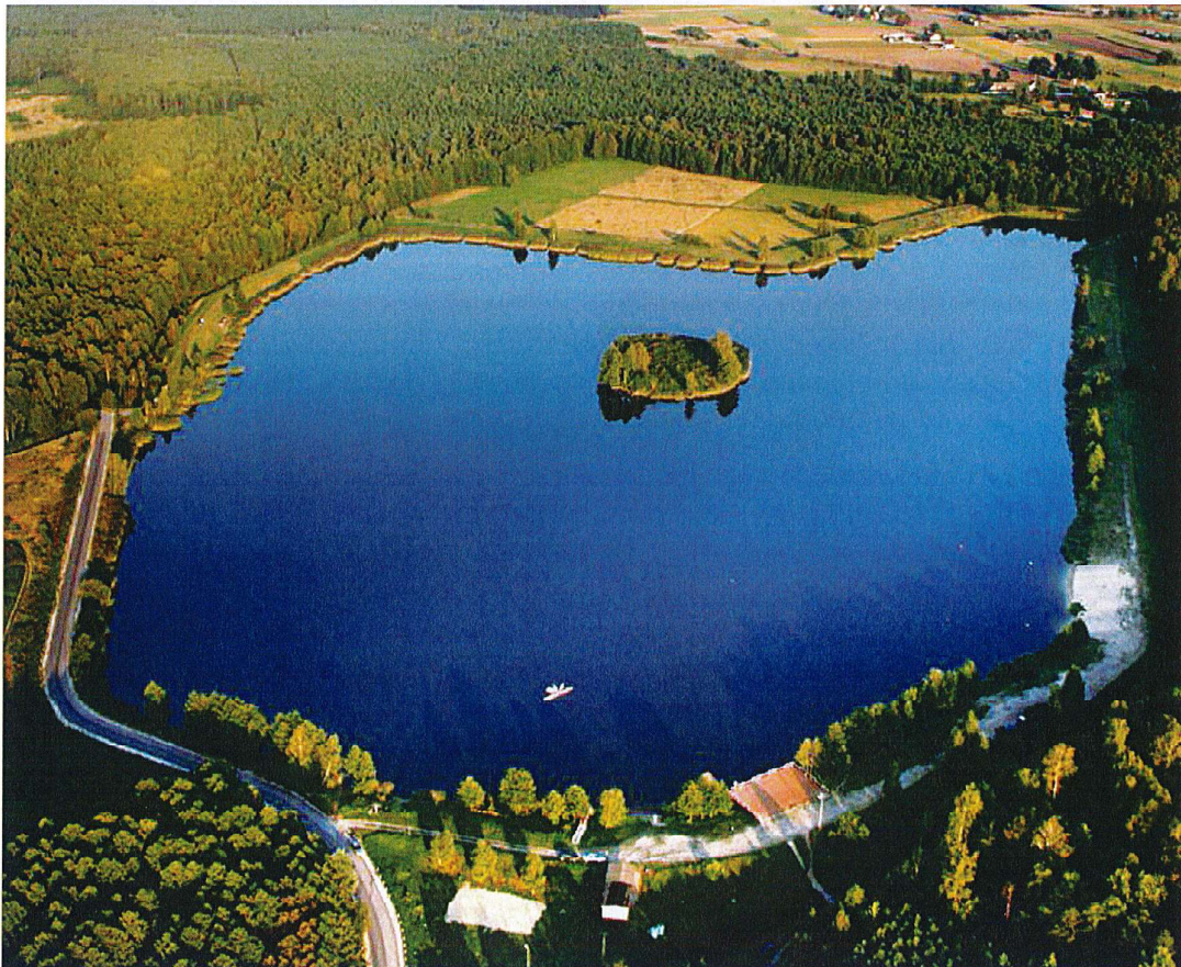
Zbiornik Wodny „KLEKOT” - widok „z lotu ptaka”

Zbiornik Wodny „KLEKOT” w miesiącach lipiec, sierpień wykorzystywany jest do kąpielii. Posiada pomost widokowy, służący również do cumowania sprzętu pływającego, infrastrukturę rekreacyjno-sportową. W okresie wakacyjnym (lipiec – wrzesień) przy Zbiorniku działa wypożyczalnia sprzętu wodnego – kajaków i rowerków wodnych. W ramach wypożyczalni dostępne są kamizelki ratunkowe. Sprzęt poza godzinami wypożyczenia przechowywany jest w magazynie sprzętu wodnego, który znajduje się pod pomostem widokowym. Magazyn zamykany jest na kłódkę.